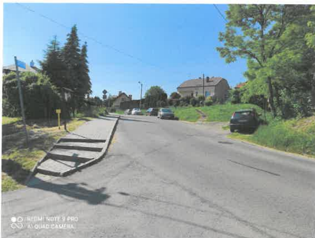
Obecny widok na ulicę Wandy