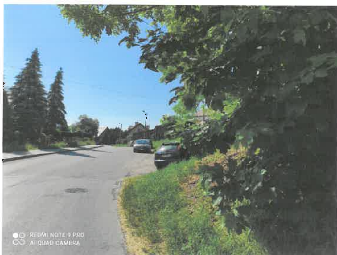
widok na ulicę Wandy z ewentualnie zamontowanym lustrem